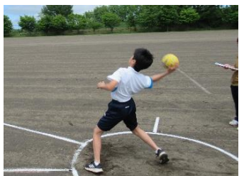
⑦ハンドボール投げ